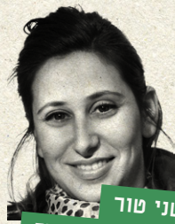
שני טור עיצוב תפאורה