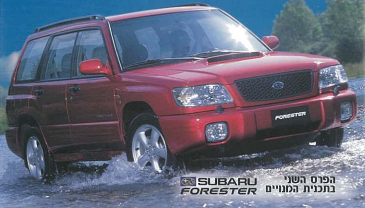
הפרס השני בתכנית המנויים SUBARU FORESTER

בכל שבוע יש זוכה ב- 1,500,000 ₪ זוכה ברכב שטח סובארו פורסטר טורבו ועוד עשרות אלפי זוכים בפרסים שונים.