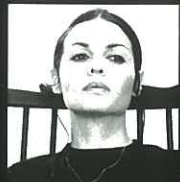
חמר, אלמנת המלחמה בימצור