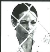
מתוך הסרט 'על חבל וק'