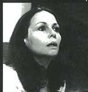
'הקול האנשי' בטלוויזיה