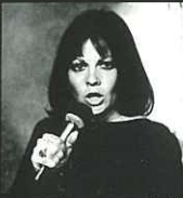
כילולה בערב שירי קברט

"פורטונה", "היבית ברחוב שלוש", "כביש ללא מוצא", "על חבל דק" ועוד רבים. גילה אלמגור זכתה עשר פעמים בפרס "כינור דה" מטעם "ידיעות אחרונות" ובפרס "ורד הכסף" מטעם "מעריב", על תפקידים בקולנוע ובתיאטרון. כן זכתה בפרסים בינלאומיים על תפקידה בסרט "מצור" ובשנת 1980 הוענק לה פרס השחקנית הטובה של השנה מטעם מרכז הסרט הישראלי. גילה אלמגור היא ממיסדי א.מי., אגודת אמני ישראל, חברה בוועד המנהל ומשמשת כדוברת האגודה.