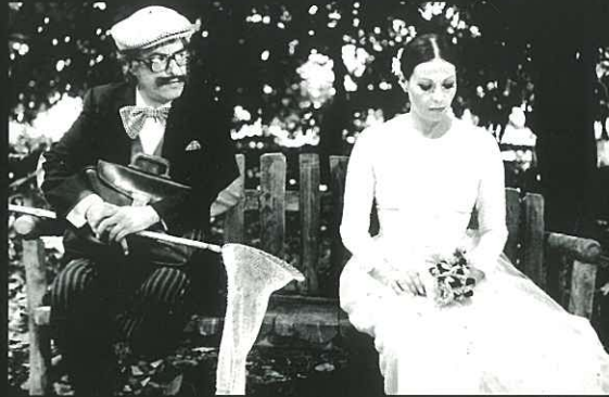
מתוך "דבלה וצייד הפרפרים"

"פורטונה", "היבית ברחוב שלוש", "כביש ללא מוצא", "על חבל דק" ועוד רבים. גילה אלמגור זכתה עשר פעמים בפרס "כינור דה" מטעם "ידיעות אחרונות" ובפרס "ורד הכסף" מטעם "מעריב", על תפקידים בקולנוע ובתיאטרון. כן זכתה בפרסים בינלאומיים על תפקידה בסרט "מצור" ובשנת 1980 הוענק לה פרס השחקנית הטובה של השנה מטעם מרכז הסרט הישראלי. גילה אלמגור היא ממיסדי א.מי., אגודת אמני ישראל, חברה בוועד המנהל ומשמשת כדוברת האגודה.