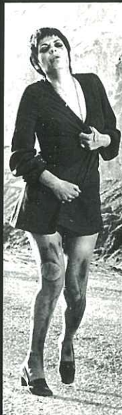
בי מלכת הבכיש