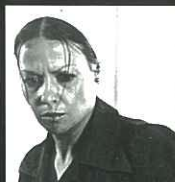
קלה ב'הבית ברחוב שלוש'