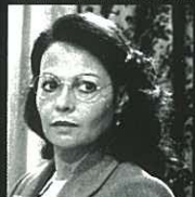
האם בסרט 'מחבואים'