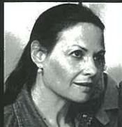
ב'כביש ללא מתא'

בתיאטרון 'האהל', 'לילה במאי', 'הכלה הציד הפרפרים' - מועדון הזמר של לולה הקטנה, 'ילדי קנדי', 'פעם בשנה' בתיאטרון בימות, 'זאן דארק' 'נשות טרויד' בתיאטרון הבימה, 'השחקן', 'הרוד' וניד', 'שלוש אחיות', 'קומדיה של טעויות' בתיאטרון הקאמרי 'ועידת פיסגה' בתיאטרון באר-שבע.