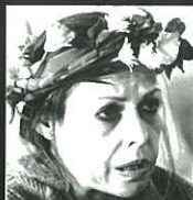
במחזה 'אדם בן כלב'