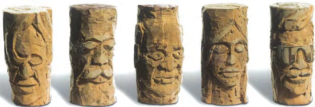
יינות הקברנה של ברקן. כל אחד והאופי שלו.