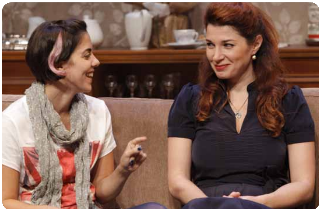
המחזה הוצג לראשונה בתיאטרון העירוני באר שבע בשנת 2000.